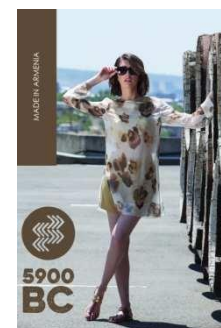
SPRING-SUMMER 2017 CAPSULE COLLECTION WWW.5900BC.AM | ТОВАРЫ В МАГАЗИНАХ 5900BC.AM