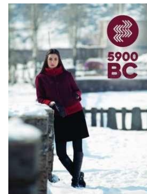
CAPSULE COLLECTION FALL-WINTER 2016-2017 MADE IN ARMENIA